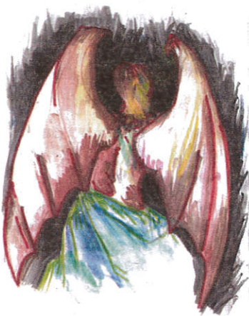
ILLUSTRAZIONE DI JEROME YPULONG